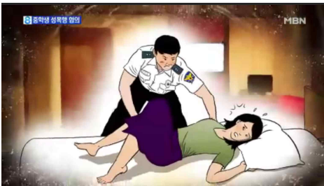
<중학생 성폭행> (MBN, 5월 28일)