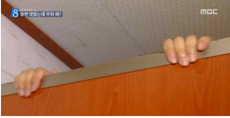
<화장실 여성 엿본 남성 '무죄' 왜?> (MBC, 5월 24일)