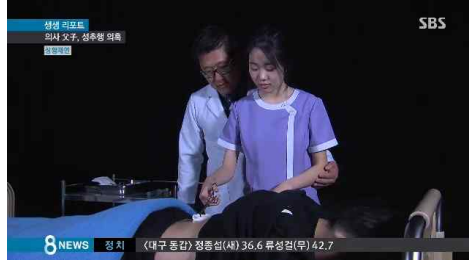
<부전자전·간호사 성추행한 의사 父子> (SBS, 4월 6일)