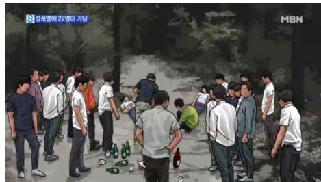
<고교생 22명이 여중생 '성폭행'> (MBN, 6월 28일)