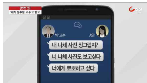
<"교수자리 미끼로 제자름"> (TV조선, 4월 3일)