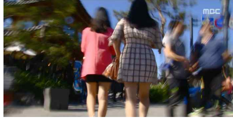
<화장실 여성 엿본 남성 '무죄' 왜?> (MBC, 5월 24일)