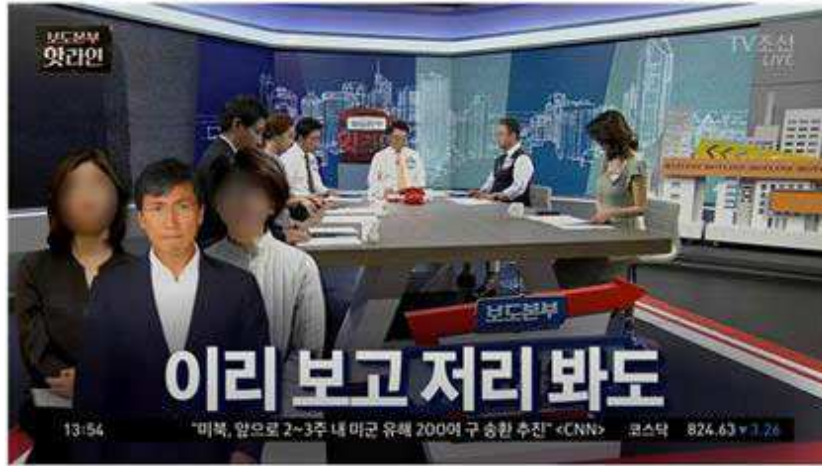
△ TV조선 <보도본부 핫라인>(7/16) 제목 화면 갈무리 <본 발제문에서는 피해자 얼굴을 모자이크 처리하였음>

마는, 부인 민 모 여사는 할 말이 굉장히 많았던 것 같습니다. 증언 내용이 지금 계속해서, 계속해서 화제가 되고 있고 논란이 되고 있어요"라고 운을 띄웠습니다. 이주라 기자는 "김지은 씨가 남편을 일방적으로 좋아해서 내가, 본인이 불쾌했다. 남편을 위협하게 할 수도 있겠다는 생각이 들었다", "김지은 씨가 안 전 지사 지지자들 사이에서는 '마누라 비서'로 불렸다" 등 민 모 씨의 여러 증언들을 열거했습니다. 이어서 "이런 증언만 본다면 김지은 씨가 마치 어떤 질투 심리를 느끼지 않았나 이렇게 해석할 수 있는 여지를 남기기 때문에 굉장히 논란"이라 해석하기도 했습니다. '논란'이라는 꼬리표를 붙여 피해자를 공격하는 듯한 해석을 굳이 강조해준 겁니다.